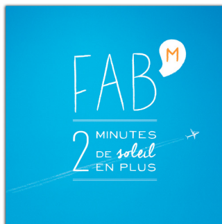
2 minutes de soleil en plus (2015)