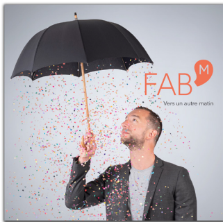
Vers un autre matin (2020)