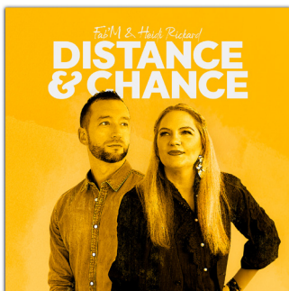
Distance & Chance (2024)