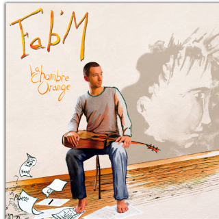
La Chambre Orange (2011)